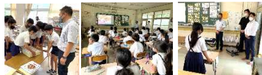
【1億円を抱えました】

7月8日(木), 福山法人会から3名の方にお越しいただき、6年生が税金について学びました。なぜ税金が必要なのか、どんな種類があるのか、どんなこと