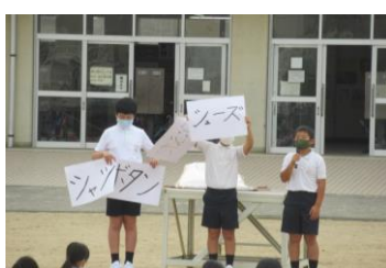
児童会による月目標