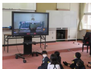
音楽室で視聴（1年2組）