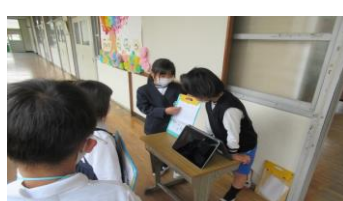
保健室動画を見せる2年生