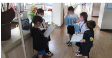
職員室の説明を受ける1年生

先日、1年生は「学校探検」を行いました。小学校の校舎地図を手に、校舎内のいろいろな教室を巡りました。案内役は、2年生のお兄さん・お姉さんです。密を避けるために少人数グループを作り、各教室を巡ります。各教室には2年生がスタンバイしており、その教室について説明しました。職員室の担当児童は、「職員室の入り方」の動画を作成し、見せていました。