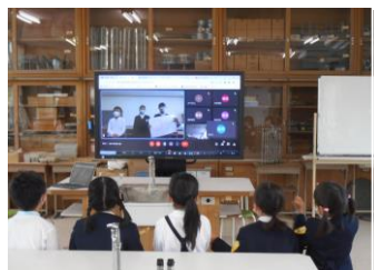
理科室で視聴（1年1組）