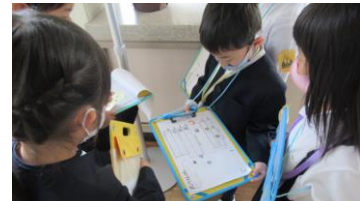
学校地図を見て移動