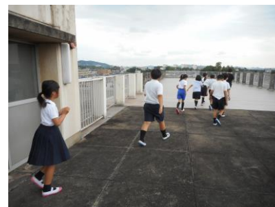
〈速やかに屋上に避難〉