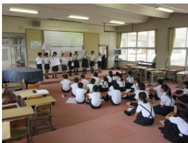
〈6年のプレゼンの様子〉

西深津小学校が開校して40年が過ぎました。今年度は、学区創立40周年として9月28日(土)に記念行事も計画しています。