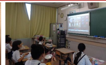
放送委員会はミーティング放送で全校を楽しませました！