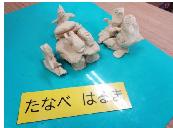
家ぞくと おすしを食べたよ