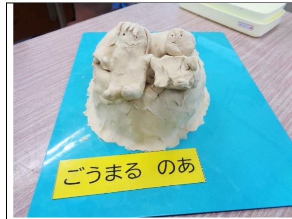
みろくのさと ドームプール

図画工作科「おもいでをかたちに」の題材では、楽しかった思い出やうれしかった思い出をもとに、表現したい場面をイメージしながら粘土をつかって表す学習を行いました。動きのある表現をするためにひねり出しの技法をつかったり、へらを使って顔の表情を工夫したりしながら、子ども達の思い出を形にしていきました。子どもたちの作品をいくつか紹介します。