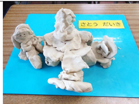
いとこのたん生日を おいわいたよ