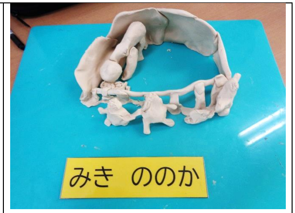
どうぶつ園のキリンを見たよ