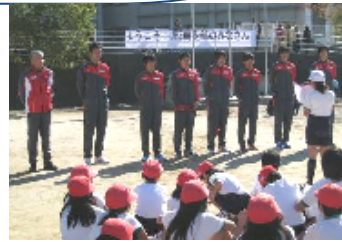
JFE スチール競走部の方に来ていただいて、持久走の走り方等指導を受けました。