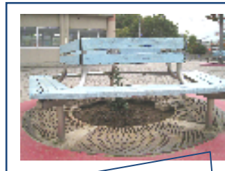
創立15周年記念に、カラータイトルのベンチの中央に植樹しました。

学習発表会には、多くの保護者の方・地域の方に来ていただき、ありがとうございました。皆様からの拍手は子どもたちの励みにもなりました。 翌日のフェスタには、朝早くから子どもたちも集まってきました。楽しいフェスタをありがとうございました。昨年に続き、地域の方は焼きそば、今年は、先生チームが、金魚すくいに参加しました。