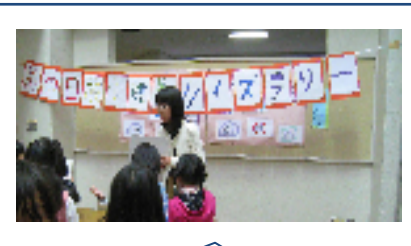
雨の日には、保健委員会による、保健クイズウォークラリーをしました。

17日には、火災避難訓練を行いました。消防署の方から家庭での初期消火についてや命を守るためのにげる方法等の話を聞きました。消火器を使って消火訓練もしました。