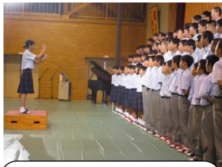
縦割りでの合唱コンクール