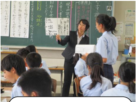
思考のすべを身に付ける