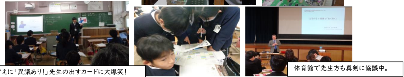
その考えに「異議あり!」先生の出すカードに大爆笑!