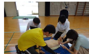
全職員で「水難救助法・心肺蘇生法」の講習を受講します。