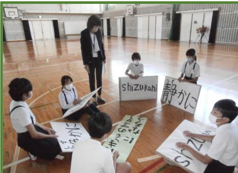
はげみ議員は、どうやったら全校児童が静かに時間を守って集合できるか 話し合い中。