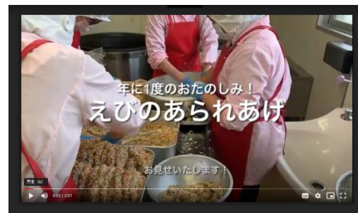
▲配信動画「えびのあられ揚げ」

3学期には、リクエスト献立のほか、1年に1度しか登場しないお楽しみ給食がたくさん登場する予定です。Google Classroom「道上食育ルーム」では、お楽しみ給食のレシピや作っている様子を動画で配信します。