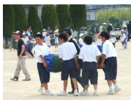
【地域貢献/ボランティア】