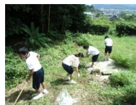
【地域貢献/ボランティア】