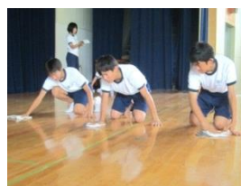
【地域貢献/ボランティア】