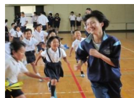
【地域貢献/ボランティア】