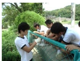
【地域貢献/ボランティア】