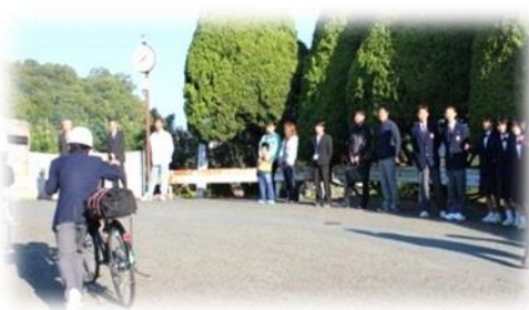
【校区あたりまえ3項目 (あいさつ)】