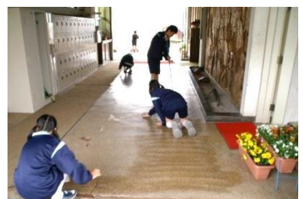
【校区あたりまえ3項目 (無言そうじ)】