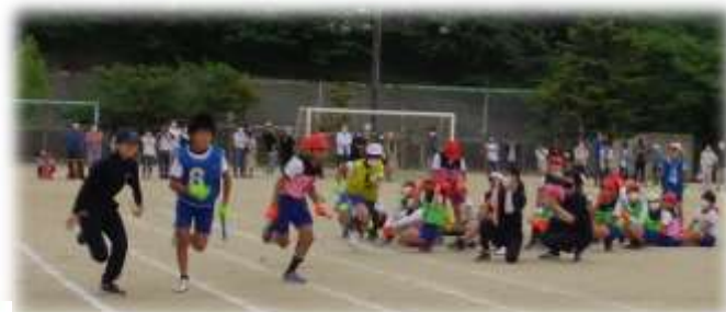
6年生 VS 先生 真剣勝負!