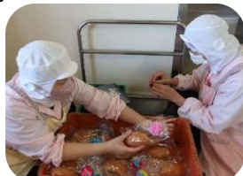
給食室で、お祝いのお花をパンの袋に付けました。