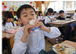
飲み残しがないように！