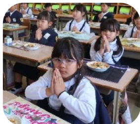
牛乳をゴクゴク飲んでるよ！