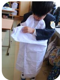
給食着は、袖をあわせてたんだよ。