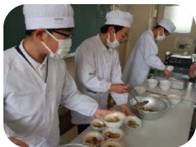
6年生と一緒に準備をしているよ。