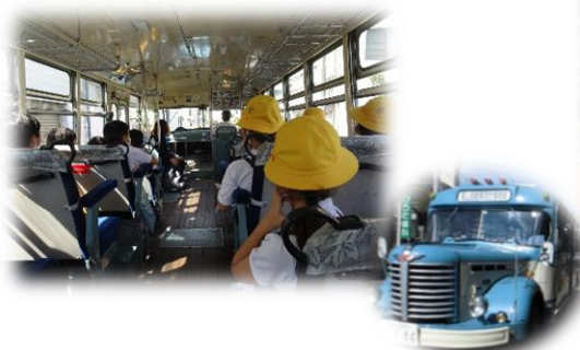
福山自動車時計博物館

また、お忙しい中、お弁当の準備をしていただき、ありがとうございました。外でみんなで食べるお弁当は、とてもおいしく、楽しい思い出の1つになったようです。