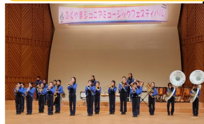
ー リーデンローズ 大ホールの舞台上で演奏しました！ー