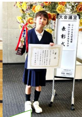
【福山小中学生俳句大会】 感じたことを素直な言葉で表しました