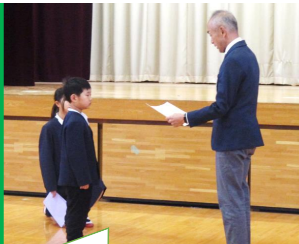
【学校元気大賞】 休日に地域のゴミ拾いを続けました

いよいよ、2学期の終業式です。 社会見学やミュージックフェスティバル、かけ足記録会などの行事をはじめ、たくさんの学習をしました。様々なことに 全力でチャレンジしながら取り組み、あきらめずやり遂げましたね。たくさんの経験を通して、一人一人が力を伸ばした2学期でした。