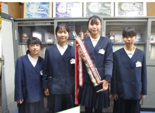
【ジュニアエコミーカレッジ2023】 自分たちで試行錯誤して取り組みました