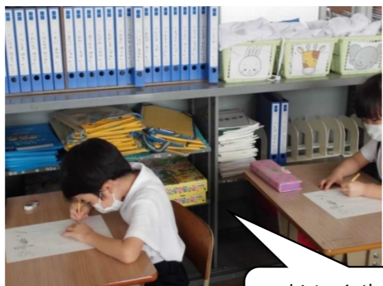
新しく片仮名を習い始めました。