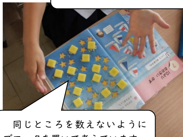
同じところを数えないようにブロックを置いて考えています。