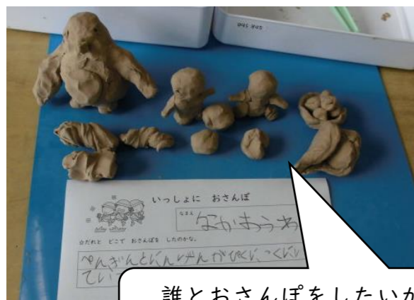
誰とおさんぽをしたいか考えながら作りました。

子どもたちからは、「音楽発表会を頑張りたい。そのために、沢山練習をする。」「算数を頑張りたい。そのためにたくさん足し算や引き算の練習をする。」「挨拶を頑張りたい。そのために、いろんな人といっぱい挨拶をする。」「新しい友達を作りたい。そのために、自分から声をかける。」などと、『一步先に進む』ために自分から挑戦したい！頑張りたい！という気持ちや、2学期をとても楽しみにしている様子が見られました。2学期が始まって、頑張っている様子をお届けします。