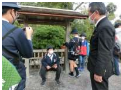
入念に計画したタクシー研修