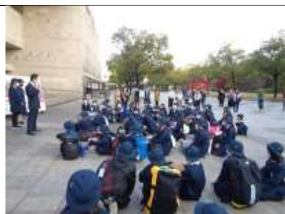
ワクワクドキドキの出発式

今後とも、子どもたちの意欲や思いを大切に、いろいろな行事や学習が充実するように知恵を働かせていきたいと思えます。