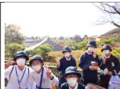
自分の目や耳、心で学ぶ見学地