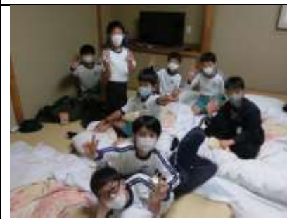
ほっとする仲間とのひととき