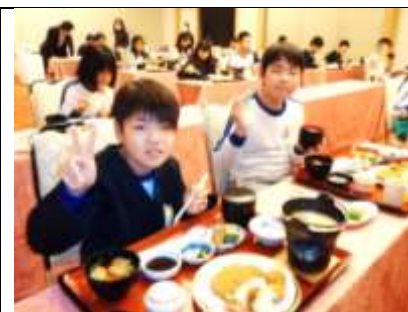
毎回楽しみだった食事