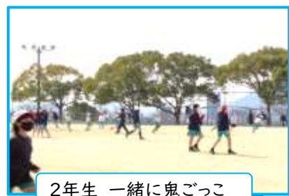
2年生 一緒に鬼ごっこ