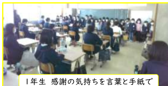
1年生 感謝の気持ちを言葉と手紙で