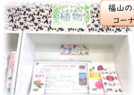
福山のプラコーナー