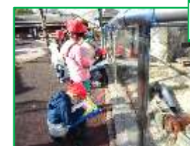
1年生 福山市立動物園