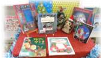
クリスマスコーナー(季節)