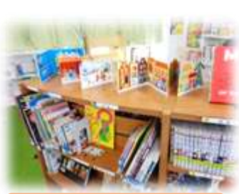
アコーディオン式の絵本も