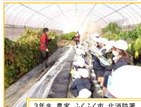
3年生 農家、ふくふく市、北消防署