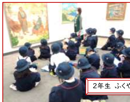
2年生 ふくやま美術館、はきもの資料館

「今度こそ、行けますように!」 「いいお天気になりますように!」と クラス全員の思いを込めて作った “てるてる坊主”がたくさん! おかげで、いいお天気になりました。