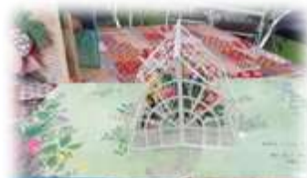
飛び出す絵本もたくさん