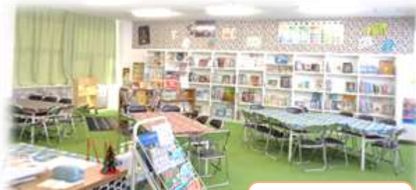
大きく変身!! 壁もジュタンも