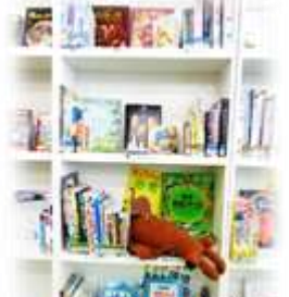
こんな所にぬいぐるみが