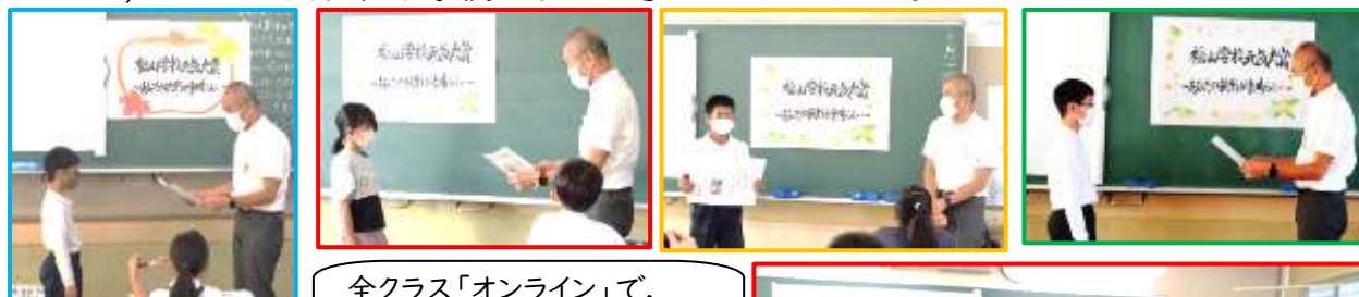
全クラス「オンライン」で, 中継をし,みんなでお祝い!

自分で考え,いろいろなことにチャレンジしていきましょう!やってみようと思い,実際に行動に移すことが素晴らしいことなのです。「自分で考え,判断・選択し,決定する。そして,行動に移しやってみる。やってみてダメだった時,次の方法を考えて再度チャレンジする。」このような,たくましい久松台小学校の子ども達でいてほしいです。