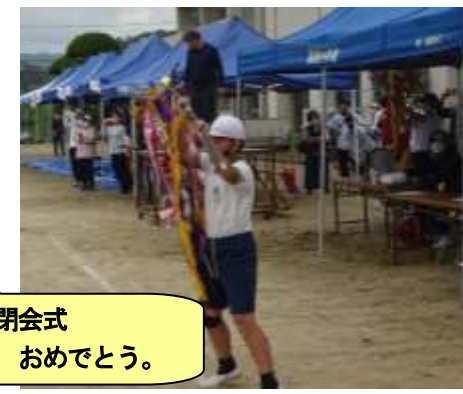
閉会式 白組優勝、おめでとう。