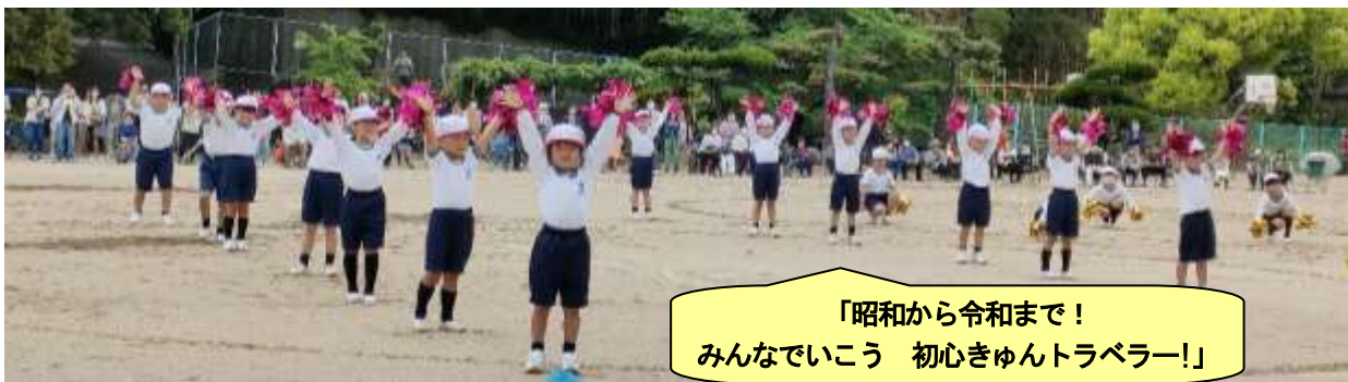
「昭和から令和まで！ みんなでいこう 初心きゅんトラベラー！」