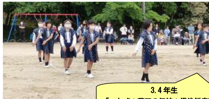
3.4年生 「つなぐ！芦田の伝統！備後絃音頭！」