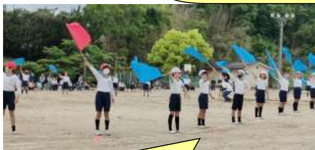
5.6年生 「一心～We Fight Together 2023～」