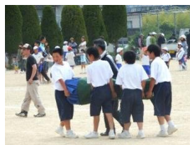
【地域貢献/ボランティア】