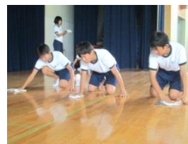
【地域貢献/ボランティア】