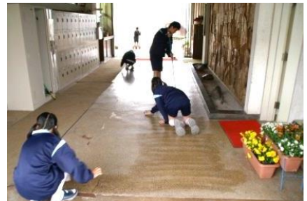
【校区あたりまえ3項目 (無言そうじ)】