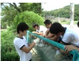
【地域貢献/ボランティア】