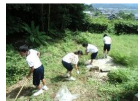
【地域貢献/ボランティア】