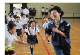
【地域貢献/ボランティア】