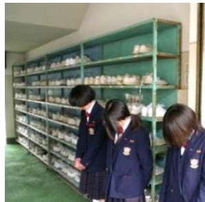
【校区あたりまえ3項目 (はきもの/無言そうじ)】