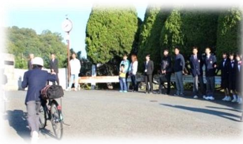
【校区あたりまえ3項目 (あいさつ)】