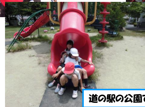
道の駅の公園で遊びました。