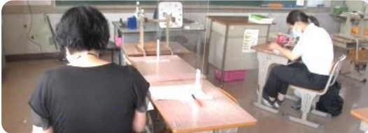
6年生の学力テストの結果分析を、担当学年での授業改善にどう活かすかを真剣に検討！