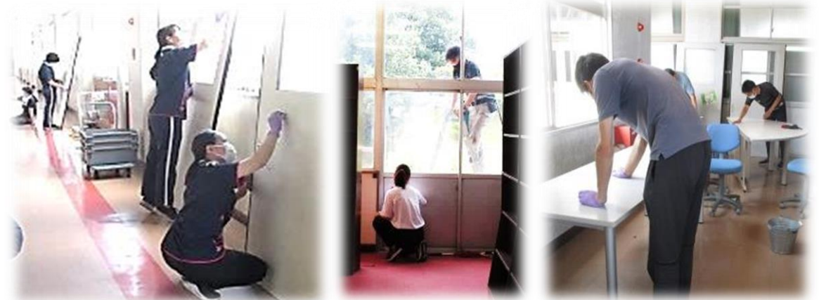
図書室の本を全て運び出し、窓やドアもしっかり磨いてピカピカになり、とても明るくなりました！

福山市教育委員会が市内小中学校で進めている図書館改装が、本校でも9月に行われます。子ども達にとって居心地の良い場所にできるよう、改装前の大掃除を行いました。