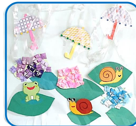
「あまやどり」(なのはな学級前) 雨の日も楽しい気分になりますね！