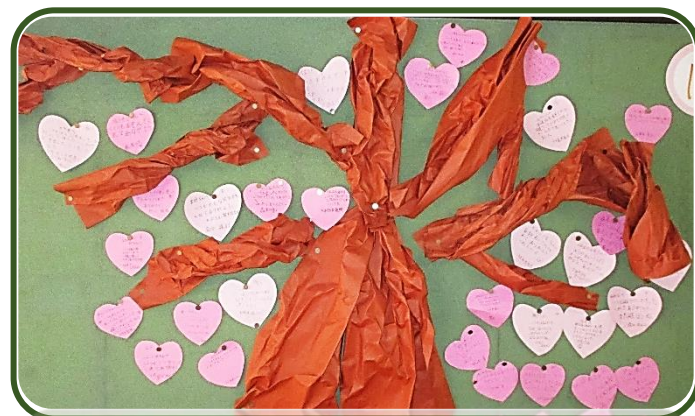
「にこにこ プロジェクト」(児童会) 友だちの素敵だなと思うところをたくさん発見！！