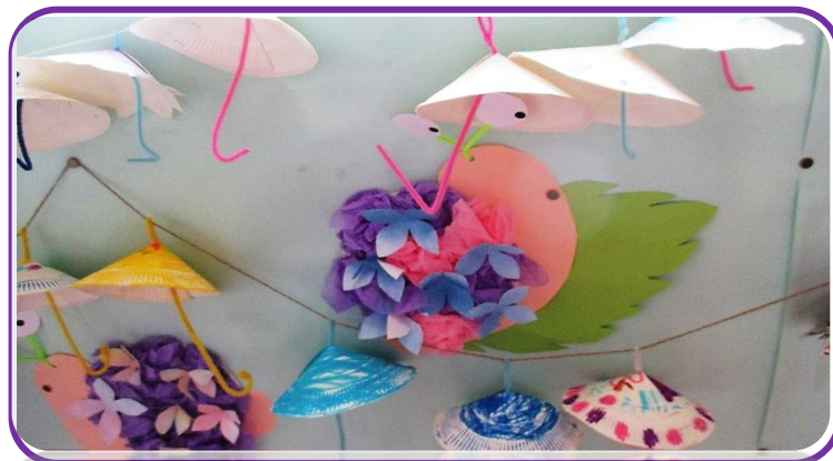
「あした てんきになあれ！」(1年生) いろいろな模様の傘があって、雨の日が楽しくなります！