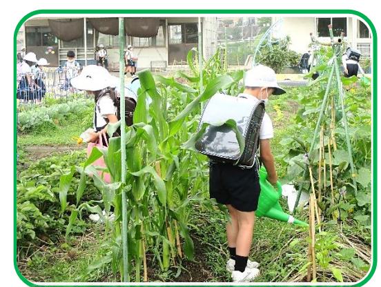
「おいしい野菜を育てよう」(各学年・栽培委員会) 野菜がどんどん大きく育っています！

1日(金) 学力補充 5日(火) クラブ活動(4年～6年) 8日(金) 野外活動保護者説明会(5年) 16:30 (体育館) 学力補充