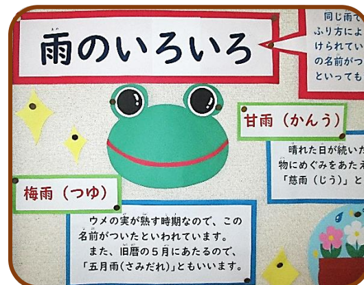
「雨のいろいろ」(図書室前) いろいろな雨があることにびっくり！