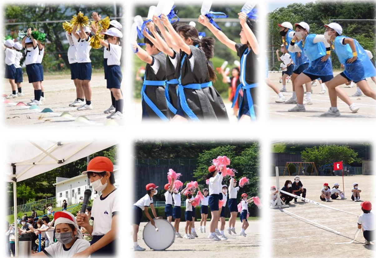
【子ども達の感想より】

5月28日(土)、爽やかな五月晴れのもと、無事体育参観日が開催されました。今年は、どの演技にも子ども達の創意工夫を盛り込み、自分達の手で演技を創り上げた体育参観日となりました。練習の成果を出し切った笑顔は最高でした。