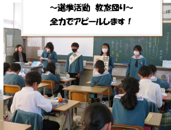
～選挙活動 教室回り～ 全力でアピールします!