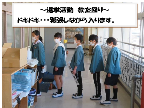
～選挙活動 教室回り～ ドキドキ…緊張しながら入ります。