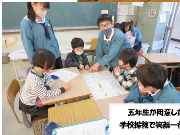
五年生が用意した遊びコーナーや 学校探検で笑顔一杯ふれあいました!