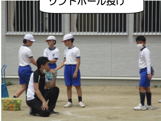
ソフトボール投げ