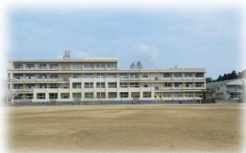
福山市立瀬戸小学校