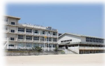
福山市立済美中学校