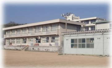
福山市立津之郷小学校