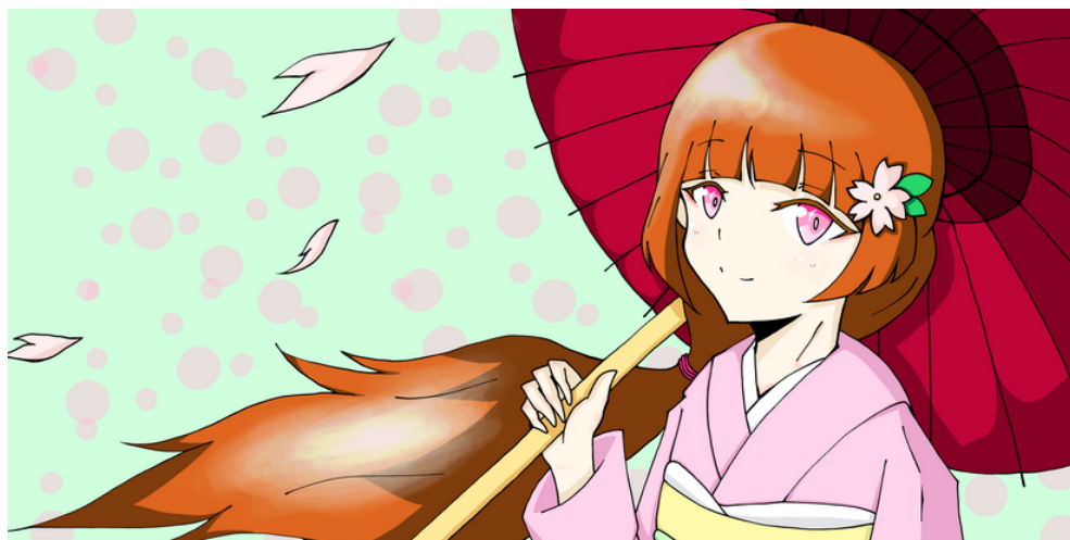
イラスト なま吉さん