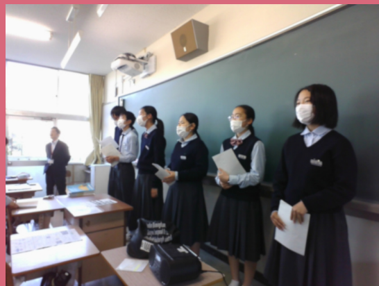
各クラスでの放課後練習