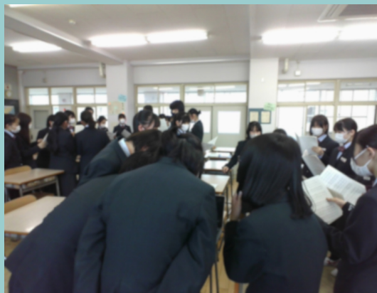
パートリーダー会での練習

6月14日に全校生徒でする合唱に向けて合唱リーダー、パートリーダーを中心にクラスや学年、パート、縦割りなど様々な形で練習を行っています。