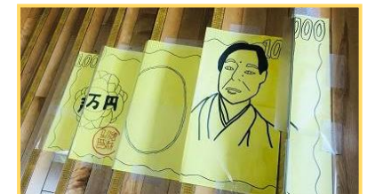
1万円の階段アートが登場!