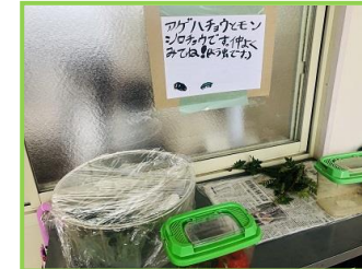
幼虫からチョウへ…ふ化が楽しみ!