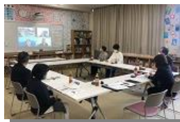
運営協議会の様子