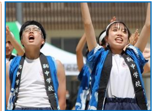
アイテアにあふれていた白組!