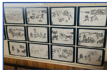
6年生の鳥獣戯画。すごい再現力!