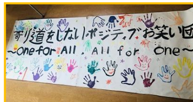
5年生の学級目標もうすぐ掲示!