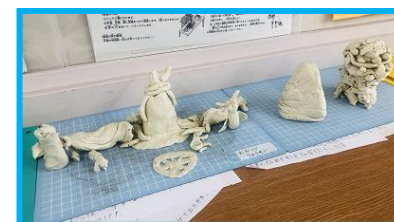
個性あふれる4年粘土作品