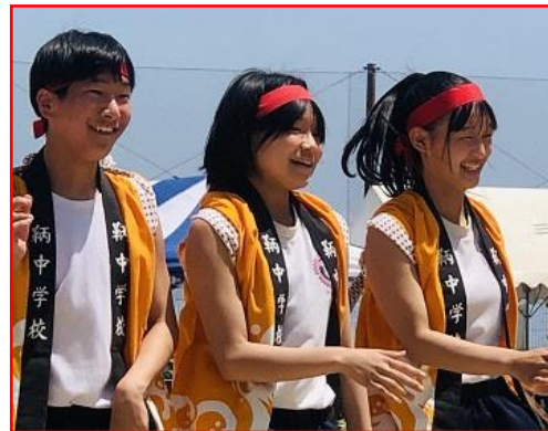
笑顔を絶やさなかった赤組!

各教室や踊り場の掲示板には、運動会の振り返りや、授業の取組がたくさん掲示され、とても賑やかになってきました。13日(火)の授業参観日は授業だけでなく、ぜひ校舎内もゆっくりとご覧ください。