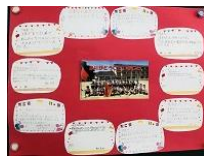
感謝のメッセージ

5月15日に今年度の第1回学校運営協議会を行いました。今年度初めての協議会は、全学年の授業の様子を見ていただいた後に、4月からの学校の取組や児童生徒の様子を話しました。その後、貴重なご意見をいただきました。素晴らしいメンバーと共に学園がさらに前進するよう進めてまいります。今年度の実施計画や協議内容はHPの「学校運営協議会」に掲載しています。