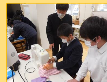
5・8年合同 ミシンでエプロン制作