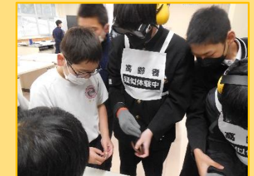
5・9年合同 高齢者体験から考える