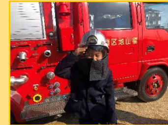
避難訓練で、消火体験や車両見学も