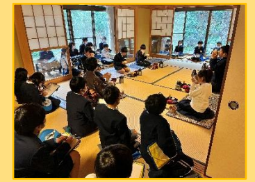
3年生もクラブ活動に仮体験！