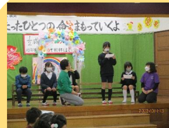
4年生が1/2成人式に参加！

生活単元「ふゆともだち」の授業で、1年生のみんなが凧あげに挑戦しました。左の児童はこのあと、200mくらい空高くあげ、みんなもびっくりしていました！ 走り出す方向、タコ糸の出し方…、うまく風を受けるための試行錯誤はまさに「学び」ですね。からまった糸も、互いに協力してほどこきました！