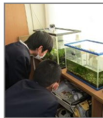
休み中、メダルは元気があったかな?

先程、各学級を回って、コロナ感染予防の徹底と3学期も元気に笑顔で過ごせますようにと話をしてきました。子ども達一人一人が毎日の生活を大事にし、たくさんの方に支えられていることに気づき、感謝し、更なる頑張りや成長につながるとういなどと思っています。