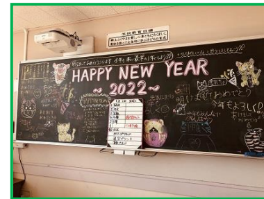
みんな楽しく仲良く、「最幸」の1年にします。(4年)