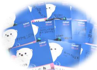
3年生の「成長ノート」