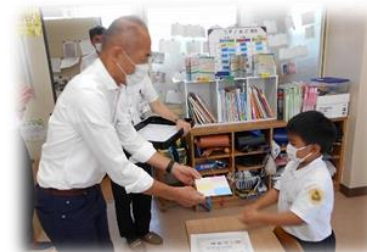
お礼に教育長さんへ手作り カレンダーをプレゼント!