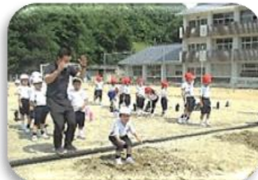
1年生の幅跳び。保健体育の教員が砂場を耕して安全面に配慮しています!