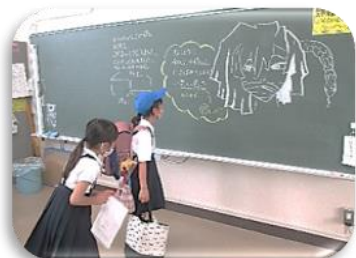
毎朝の担任からの問題(挑戦状)学習した内容の定着を図っています!