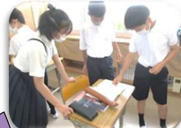
5・6年生の自主勉強ノート交換 互いのいいところを発見し学びあう!