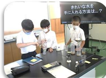
4年生～6年生による学年を超えた学習「チャレンジタイム」 「6年生ってさすが!」「4・5年生と協力するのいい考えが出るな」などの声が!