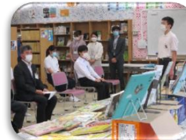
図書寄贈式 ～6月19日学校図書館にて～