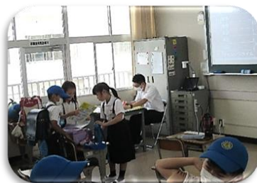
毎朝、教室に入ってくる子ども達をそっと見守りながら迎えています!