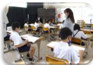
担任と国語科教員で2グループに分かれ少人数による丁寧な指導を!