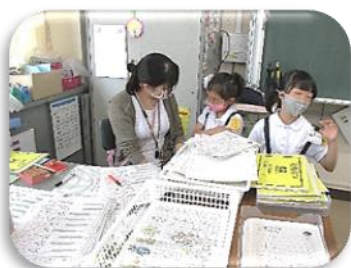
手をとめて顔を見ながら話を聞くことで子ども達はほっと安心、元気が出ます!