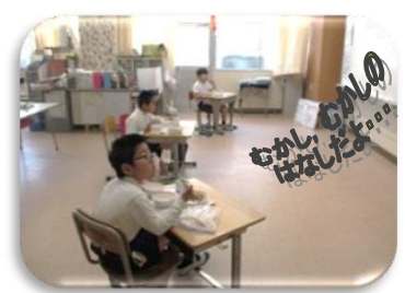
図書ボランティアさんの録音による読み聞かせ放送にじっと聞き入る子ども達