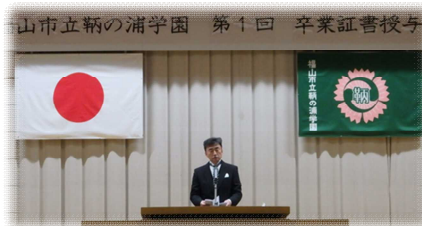
学校長式辞で語られた信頼の言葉 「あなたが9年生でよかった」