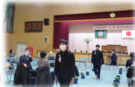
温かい拍手で送られる卒業生。様々な思い出がよみがえってきますね。