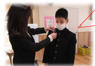
受付で、給食の先生手作りの花飾りを胸に付けてもらい、教室へ！