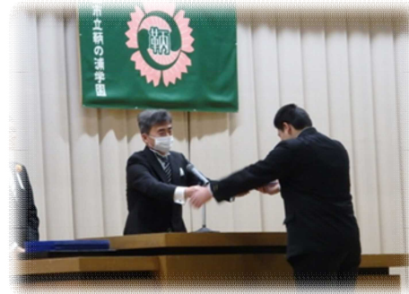
学校長より1人1人が、卒業証書を授与されました！