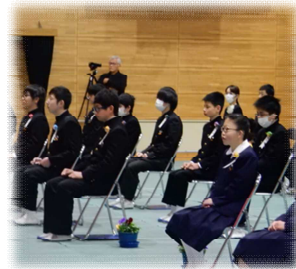
それぞれの思いを胸に・・・