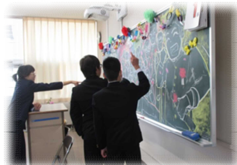
校舎内の写真や黒板のイラストを卒業生達は、嬉しそうに見入っていました！！