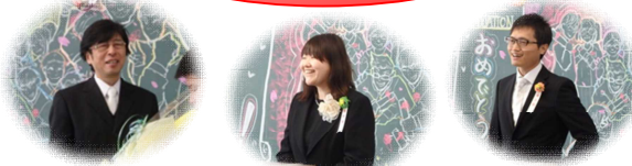
9年団の先生方の子も達に向けた笑顔も素敵でした！