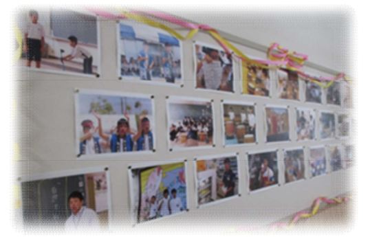
校舎内には、子ども達の、懐かしい写真が！