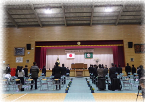
会場は、温かな雰囲気に入れられ・・・ いよいよ開式です！