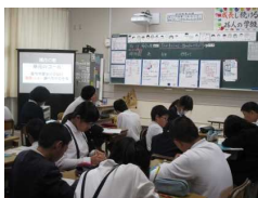
6年生 算数 場合の数 ～効率のよい方法は？～