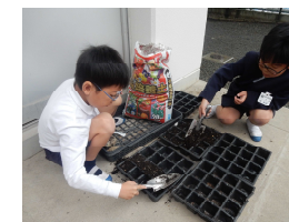
昨年秋、この取組のきっかけをつくったつくし学級の子ども達。育てたナデシコからとれた種を今年もまきました。鞆の浦学園2世のナデシコを育てています！