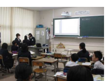
5年生 社会 「社長になろう！」 ～工場をどこに建てる？～