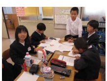
4年生 鞆学 「TOMO BOUSAIリーダー」 ～鞆に住む人の命を守る～