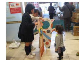
顔出しパネルで子ども 連れのお客さんもゲット！