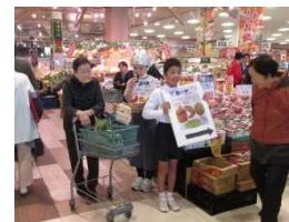
手作りポスターを持って お客様に猛アピール！

パン作りやポップ作りなど、販売までに関わってくださったゲストティーチャーさん、惜しみなく協力してくださったエブリイの従業員さん、温かく見守ってくださった関係者の皆様に感謝の気持ちでいっぱいです。ありがとうございました。