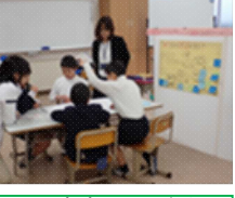
「義務教育学校から考える“10年後の学校”」 鞆の浦学園職員と公開研究会に参加された他校の先生方との熱心な意見交流。