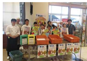
予想以上の売れ行きに みんな大興奮！！