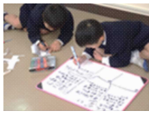
2年生 算数 かけ算 ～めざせ！かけ算マスター～