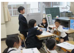
1年生 算数 たし算 ～いくつになるの？～

鞆の浦学園では、一人一人の教員が、子ども達の「なぜ？」「わからん、教えて！」「やった、わかった、できた！」「もっとやりたい！」などの声のする授業や共に考え、話し合い、学び合う、みんなとともに自信を育てる授業をめざして日々授業改善に取り組んでいます。先週金曜日には、授業公開を通して、これまでの取組を他校の先生方に見ていただき、子ども達が自分の成長を実感し、意欲を持って学びたいという授業づくりに向けて、意見を交流しながら考え合いました。子ども達の学ぶ意欲だけでなく、先生達の教育に対する熱意を感じる充実した時間となりました。