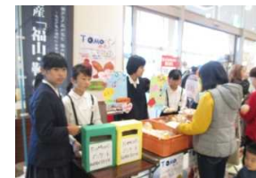
販売も6年生の子ども達 だけで全て行いました！