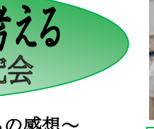
6年・9年合同 鞆学 TOMO 自慢 ～Welcome to Tomonoura～