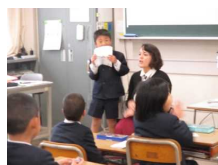
3年生 外国語活動 This is for you. ～カードをおくろう～