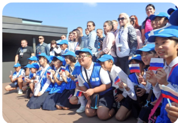
訪日団の皆さんは、6年生の子ども達のお迎えに大変喜ばれ、和やかな雰囲気での交流に!