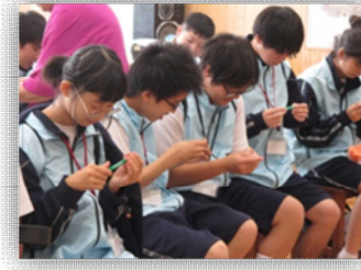
美術で製作した「鞆」や「日本」の文字を表現した鍋敷きをプレゼントしました。