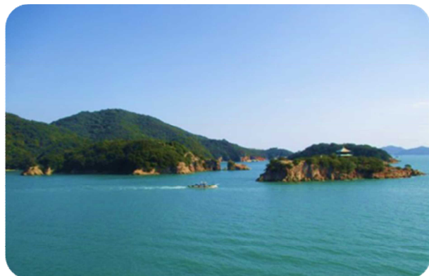
公民館屋上からの景色も美しく、ロシア訪日団の皆さんも絶賛されていました。