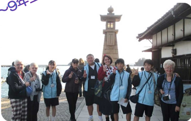
なでしこ太鼓の演奏の迫力に大変感動されておられたそうです。皆さんの笑顔が印象的でした。