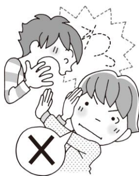
みみもと おおこえ だ さない 耳元で大声を出さない