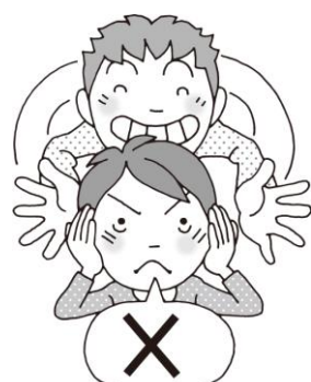
みみ みみ ちか ただ かない 耳や耳の近くを叩かない