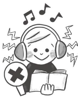
おんりょう あ イヤホンの音量を上げすぎない