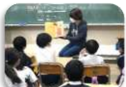
図書ボランティアによる読み聞かせ