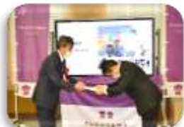
鞆学～福山ブランド認定・登録～ 2023(令和5)年度末まで有効