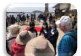
英語で行うボランティアガイド