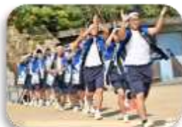
実行委員会主催の運動会