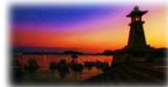
「瀬戸の夕風(ゆうなぎ)が包む 国内唯一の近世港町 ～セピア色の港町に日常が溶け込む鞆の浦～」

気高く匂う なでしこは 学びの丘に 咲き満ちる 世界の平和 祈りつつ 理想を高く 掲げよう 空も心も 澄んでいる みんなの学園 鞆の浦