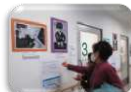
児童生徒による地域への作品展