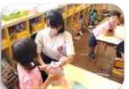
地元事業所での職業体験(7・8年生)