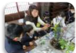
伝統文化体験(華道・茶道・座禅)