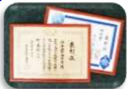
令和3年度広島県教育奨励賞 福山学校元氣大賞受賞「特別賞」