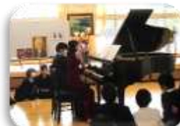
多様な学びの場である多目的ホール