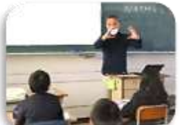
鞆学プロボノメンバーによる出前授業