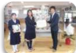
学園会主催の感謝状贈呈式