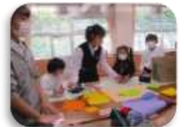
チャレンジタイム(学年を超えた学び)