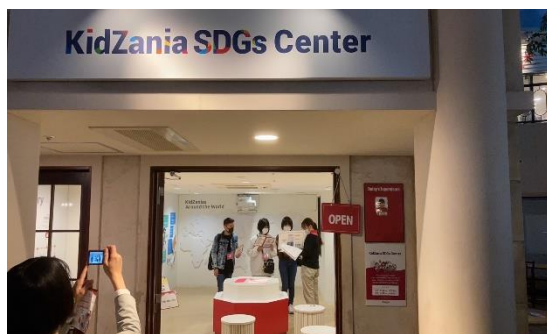
【KidZania SDGs Center にて】