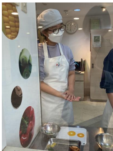
【サラダショップにて】