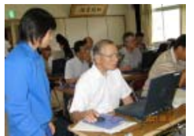
パソコン大学での講師助

いろいろな職場で働き、たくさんの人に関わり、相手の気持ちを考えて接することができた。