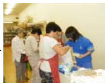
「きりり山野」での接客

いろいろな職場で働き、たくさんの人に関わり、相手の気持ちを考えて接することができた。