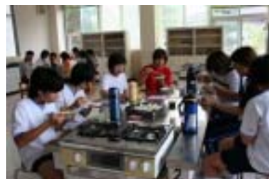
第2学年：ランチタイム