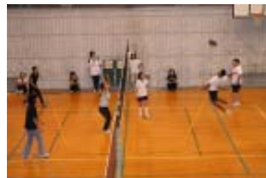
第3学年：ソフトバレー