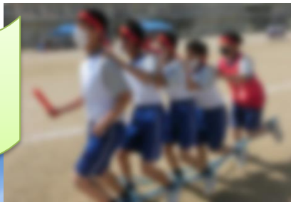
足並みそろえて ダッシュ