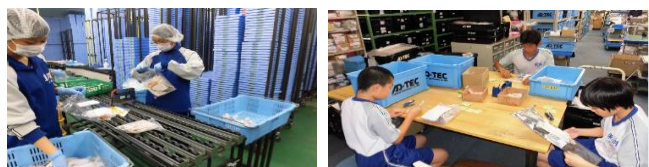
チャレンジウィーク