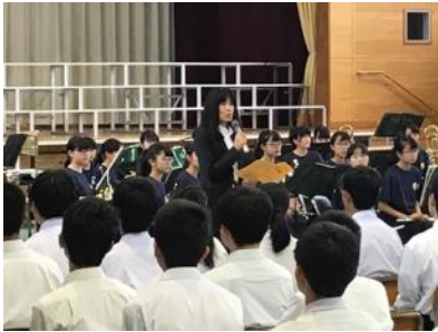
校長先生のあいさつ

10月19日(土)にオープンDAYを行いました。本校は生徒が自ら考え、主体的に行動することができる力を身に付けるべく、課題発見解決学習を推進しております。ここで身に付けた力を発揮すべく、オープンDAYにむけても3年生のリーダーを中心として練習計画を練り「感動する歌声を届けたい」という想いのもと、各団、全校で生徒自ら合唱練習を続けてまいりました。今日は、その成果が十分に発揮され、テーマ「響け70年の想い、つなげ新たなる時代へ」が伝わったといえます。