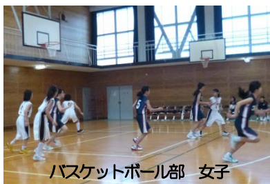
バスケットボール部 女子