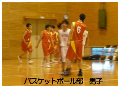
バスケットボール部 男子