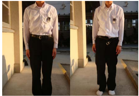
シャツは、ズボンの中に入れる