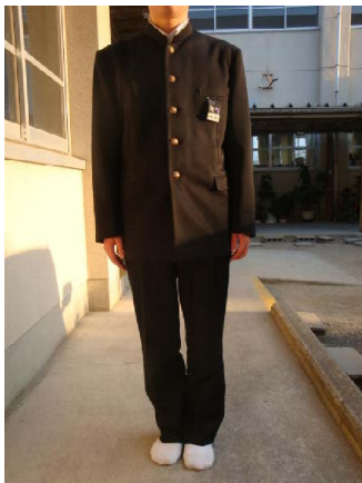
第1ボタンまでとめる。ホックは、式の時にはとめる