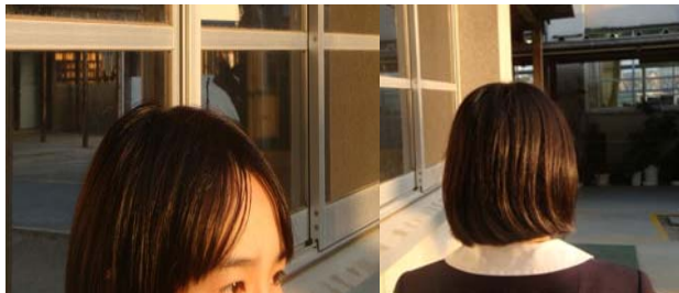
前髪は目にかからない