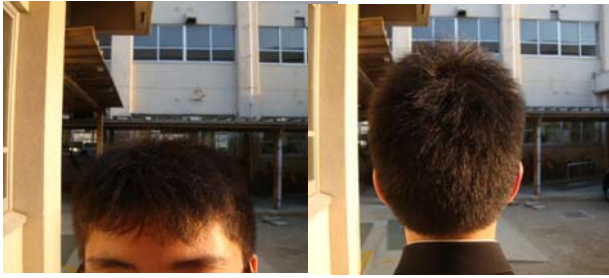
前髪は目にかからない