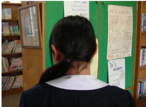
肩にかかる場合は、ゴムで束ねる (受験は2つくりが望ましい)