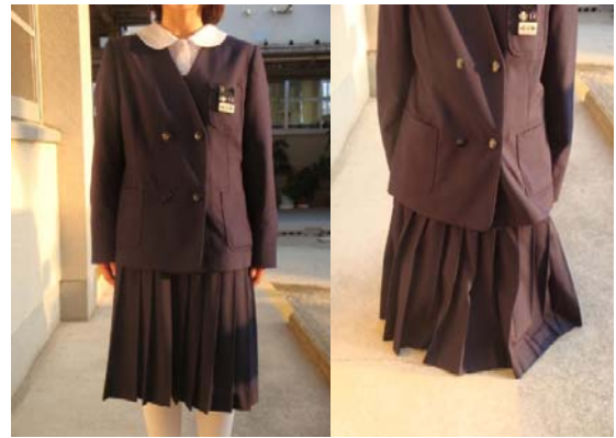
冬服 (巾着ジャンパースカート)